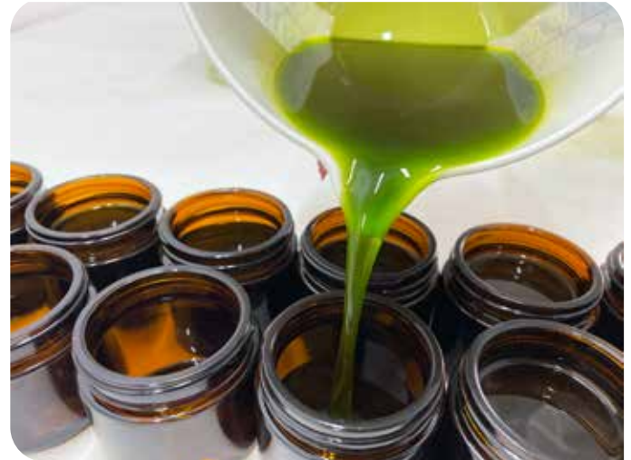
Hér má sjá framleiðslu á hampsmýrslu.