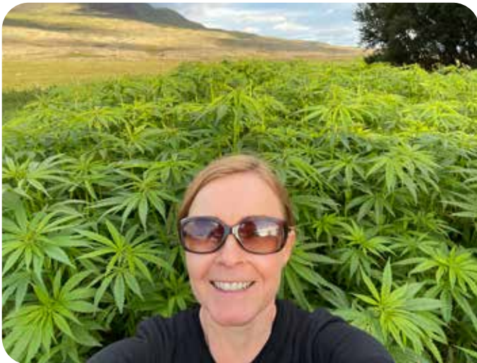
Oddný fyrir framan Felinahampbed. Myndin var tekin um miðjan ágúst og átti hampurinn enn eftir að vaxa töluvert.

„Við erum aðallega með yrki sem kallast Finola, sem er svokallað blómayrki því við nýtum aðallega blómin. Stönglarnir verða ekki digrir og trefjarikir og henta því ekki til iðnaðarframleiðslu en nýtast sem undirburður fyrir skepnur og jafnvel sem fóður. Þeir sem ætla að nýta stönglana hafa verið að rækta Futura, sem er trefjayrki sem við prófuðum fyrsta sumarið. Við höfum líka verið að rækta Felina, sem er bæði blóma- og trefjayrki og verður mun hærra en Finolan, en blómavöxturinn hefst seinna, sem hentar síður hér á landi þar sem sumarið er svo stutt. Finola, Felina og Futura eru öll fimm mánaða yrki, en við þurfum að finna góð fjögurra mánaða yrki svo plantan nái fullum blómavexti og nái að búa til fullþroskuð fræ fyrir fyrstu haustlægð og næturfröst. Vandamálið er að við megum bara flytja inn þau yrki sem eru á sáðvörulista ESB og hafa ekki verið þróuð fyrir svona stutt og svöl sumur, en ekki þau sem eru notuð t.d. í Kanada og Alaska. Verkefni bænda næstu árin er því að finna yrki sem henta vel á norðlægum slóðum.“