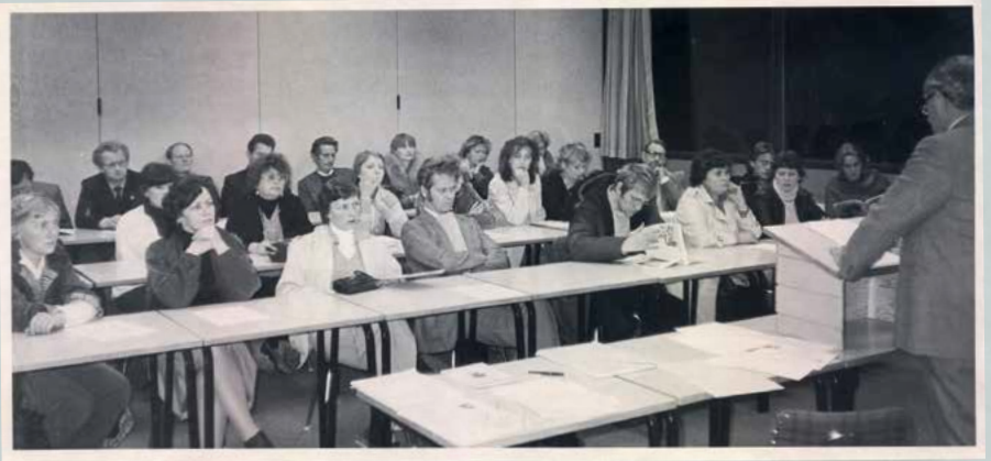
Stofnfundur Neytendafélags Austur-Skaftafellssýslu var haldinn á Höfn í Hornafirði