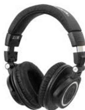
Bestu einkunn fá heyrnartólin frá Audio-Technica.