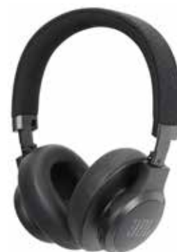
Í öðru til fjórða sæti eru heyrnartól frá JBL.